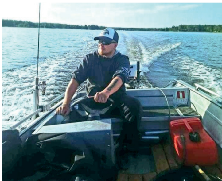
Vaasan saaristoluonto on minulle vaalimisen arvoinen paikka, jossa sielu lepää.

Vaasan Perussuomalaisten hallituksen jäsen Kauppateknikko Insinööri (AMK)